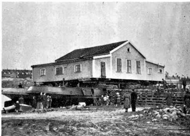
Klart för avgång från Saltö.