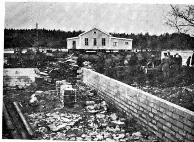
Klubbhuset framme i Killingeviken.

Det låter ju ganska enkelt men dessförinnan hade många av sällskapetets duktiga medlemmar fått offra mycket av sin fritid för att iordningställa terrängen och den provisoriska kajen för ilandtagning av klubbhuset från pråmarna. Namnen på dem alla kan ej uppräknas här utan det räcker med att säga att de utfört ett stort arbete för sitt sällskap.