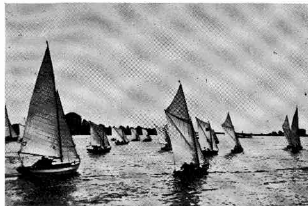
Blekingsekor i kappsegling på 1930-talet.

Ären går under arbete och segling. 1920 anordnades en första propagandasegling tillsammans med CBE för att